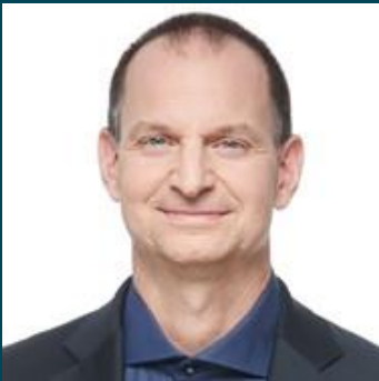
Coalition Avenir Québec