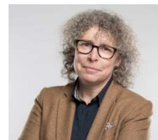
Geneviève Morin Fondation